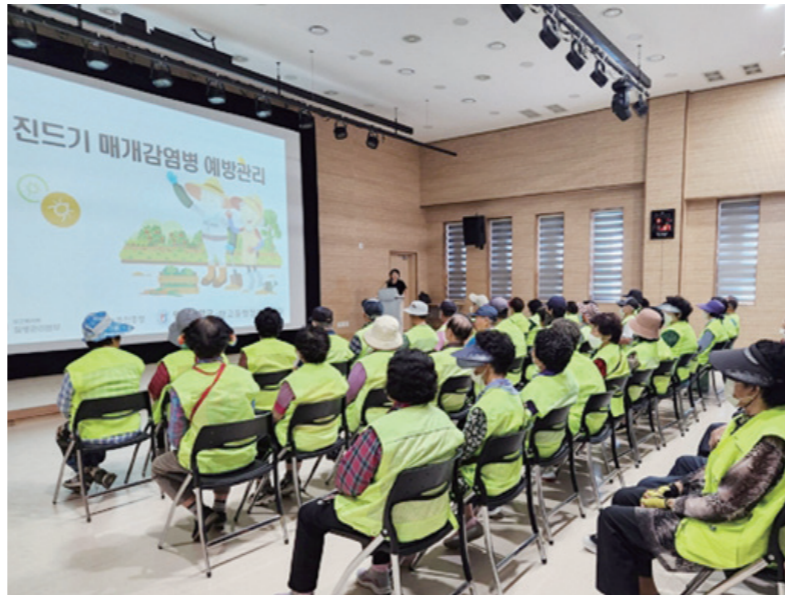
남원시에서 올해 첫 중증열성혈소판증후군(SFTS) 환자가 발생했다. 2023년 9월 남원시가 향교동 행정복지센터에서 노인 일자리 참여 여성들을 대상으로 진드기 매개 감염병 예방 교육을 실시하고 있다.

야외에서는 풀밭 위에 바로 눕거나 옷을 벗어두는 행위를 피해야 한다. 풀밭 위에 앉을 때는 돛자리를 펴서 앉고 사용 후에는 세탁하는 것이 좋다. 진드기가 붙어 있을 수 있는 길고양이나 야생동물과 접촉을 피해야 한다. 농작업이나 야외 활동 후에는 입었던 옷을 세탁하고 샤워나 목욕을 하는 것도 잊지 말아야 한다.