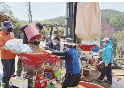
서산시가 '벼 종자소독 및 못자리 현장 중점지도반'을 편성·운영한다.

또한 못자리 설치 시 한 상자당 파종량은 중도 기준 150g이 적정하며 상자 쌀기와 육묘 시 30도 이상의 고온은 피해야 벼 카다리병 발생을 최소화할 수 있다. 벼 종자소독 및 못자리에서 문제 발생 시 서산시 기술보급과에 문의하면 된다.