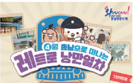
'충남으로 떠나는 레트로 낭만열차'가 23일 첫 운행을 앞두고 있다.