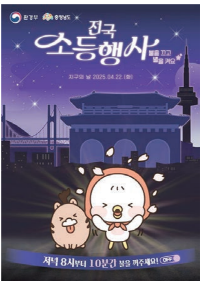
충청남도는 '제55주년 지구의 날'을 맞아 22일 오후 8시부터 10분간 소등 행사를 진행한다.

이 기간에는 '해보자고 기후행동! 가보자고 적응생활!'을 주제로 탄소중립에 대