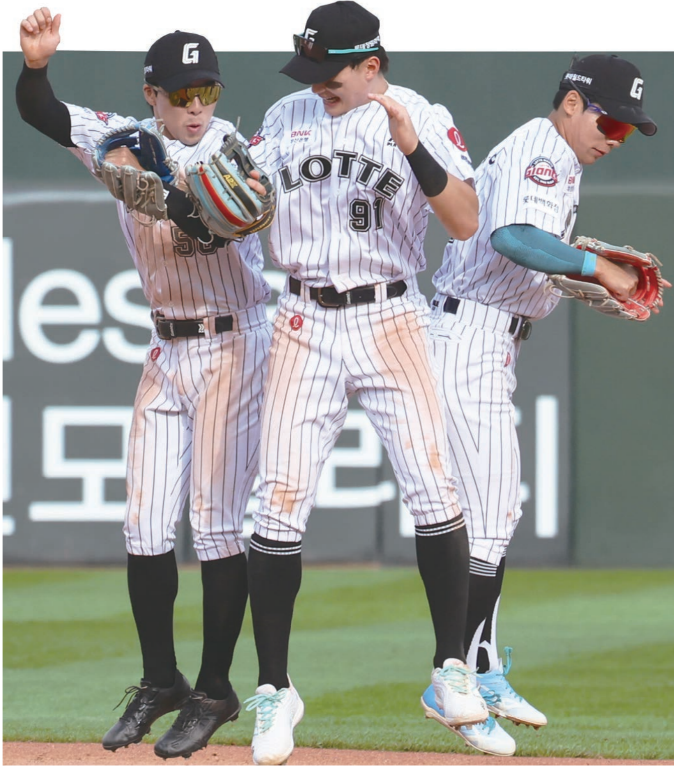
롯데 선수들이 18일 부산 사직야구장에서 열린 프로야구 2025 신한 SOL뱅크 KBO리그 삼성 라이온즈와 롯데 자이언츠의 경기에서 6-3으로 승리한 후 기쁨을 나누고 있다.