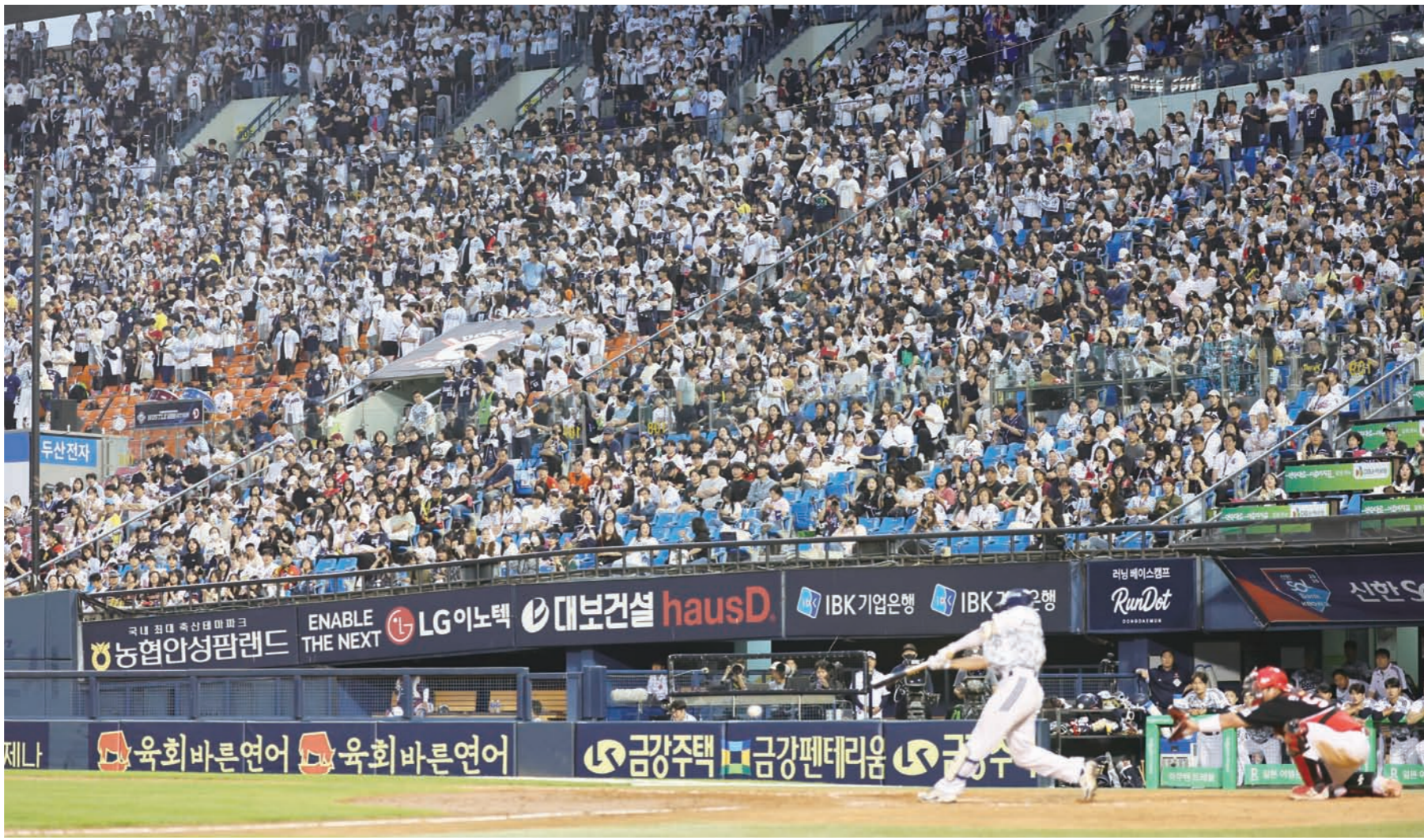
5일 서울 잠실야구장에서 열린 프로야구 KIA 타이거즈와 두산 베어스의 경기가 관중들로 꽉 차 있다. 이날 경기는 전석 매진됐다.