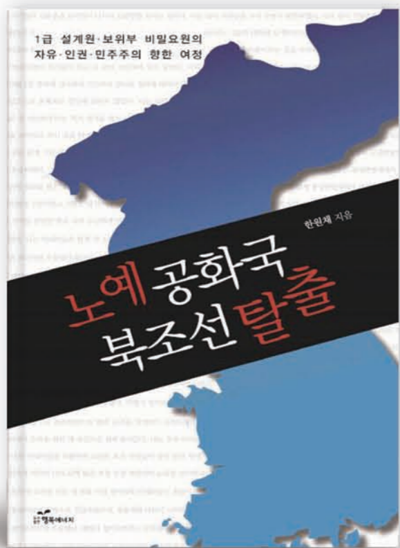
한원재 지음 | 312쪽 | 15,000원 | 도서출판행복에너지