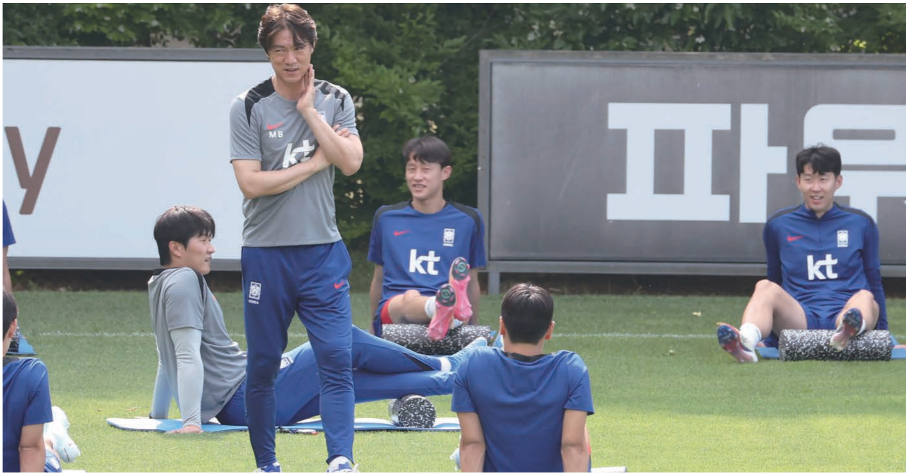
지난달 8일 파주 국가대표트레이닝센터(NFC)에서 북중미 월드컵 예선 최종전을 앞둔 축구 국가대표팀 흥명보 감독이 선수들을 지켜보고 있다.

한국은 지난달 막을 내린 북중미 대회 아시아 3차 예선을 통해 11회 연속이자 통산 12번째 월드컵 본선 진출을