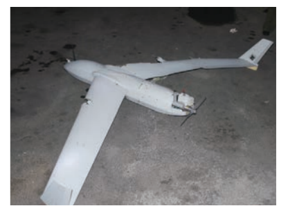
지난해 10월19일 북한이 평양에서 한국군에서 운용하는 드론과 동일 기종의 무인기 잔해를 발견했다고 주장하며 관련 사진을 공개했다.

더불어민주당은 3일 "윤석열이 드론을 평양 상공에 투입하라고 직접 지시했다는 군 지휘관의 녹취가 공개됐다"며 "녹취가 사실이라면, 윤석열과 김용현은 대한민국을 전쟁의 위기로 몰아넣으려고 시도한 것"이라고 비판했다. 김지호 대변인은 이날 브리핑에서 이같이 말하고 "한 사람의 권력을 지키려고 국군을 정치의 도구로 삼아 전쟁 위협을 조장하려고 했더니 끄적하"고 했다. 이어 "더욱 심각한 것은 국가안보실이 작전을 정식 군 통제 체계 밖에서 추진했고, 증거 기록을 조직적으로 폐기했다는 의혹"이라며 밝혔다. 또한 "대한민국 군은 국민의 생명과 안전을 지키는 존재이지, 정권의 안위를 지키는 수단이 아니다"며 "윤석열 한 사람의 권력욕에 군의 기강은 물론