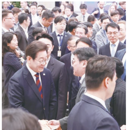
이재명 대통령이 3일 청와대 영빈관에서 열린 '대통령의 30일, 언론이 묻고 국민에게 답하다' 기자회견을 마친 뒤 취재진과 인사하고 있다.

과 정책 방향을 국민과 소통하기 위해 눈을 맞추는 대통령의 모습은 오만과 독선, 불투명한 3년이 끝나고 정상적인 정부가 들어섰음을 모든 국민에게 확인시켜 줬다"고 설명했다. 박 수석대변인은 "숨 가쁘게 30일을 달려왔지만, 민생회복과 경제의 선순환 구조 복원, 사회안전망 구축, 국의 중심 실용외교, 권력기관 개혁 등 많은 과제가 남아 있다"며 "이 대통령이 앞으로 내란의 역경을 빛의 혁명으로 이겨 내신 위대한 국민의 저력을 모두가 잘사는 진짜 대한민국을 만드는 원동력으로 바꿔 내실 것으로 기대한다"고 밝혔다. 그러면서 "민주당 또한 국민권정부와 보조를 맞추며 소통과 협력의 국회를 만드는 한편, 대한민국 정상화에 온 힘을 다하겠다"고 강조했다.