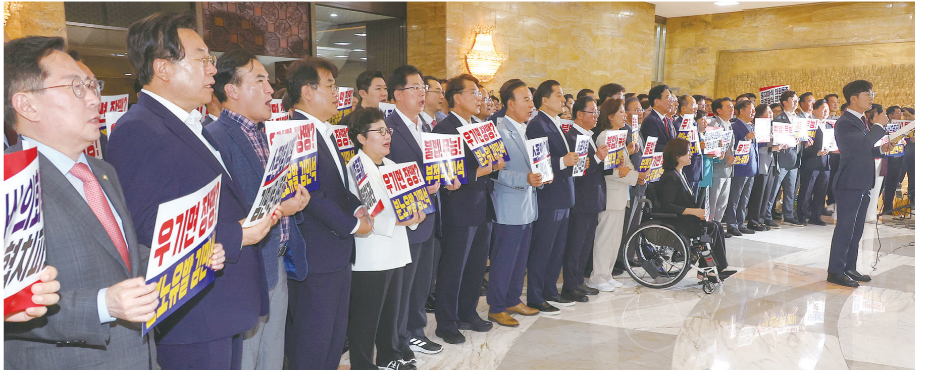
국민의힘 의원들이 본회의가 열리고 있는 3일 서울 여의도 국회 로텐더홀에서 김민석 국무총리 후보자 임명동의안 등을 규탄하고 있다.

정상화시켜야 한다"고 강조했다. 김 총리는 페이스북에서 '국회 인준에 감사드립니다'는 글을 통해 "국민의 뜻을 하늘같이 받들고, 대통령의 방향을 바다에서 풀어내고, 여야를 넘어 의원들의 지혜를 국정에 접목시키겠다"고 밝혔다. 또한 "폭정 세력이 만든 경제위기 극복이 제1과제"라며 "대통령의 참모장으로서 일찍 생각하고 먼저 행하는 새벽 총리가 되겠다"고 강조했다. 한편, 국민의힘은 김 총리 후보자 임명에 반발해 표결을 거부하며 본회의에 불참하고 국회 로텐더홀에서 표결 강행에 항의하는 규탄대회를 벌였다. 송인석 국민의힘 비상대책위원장 겸 원내대표는 "한 달 전 이재명 당시 대선후보는 소통과 협치를 복원하겠다고 말했다"