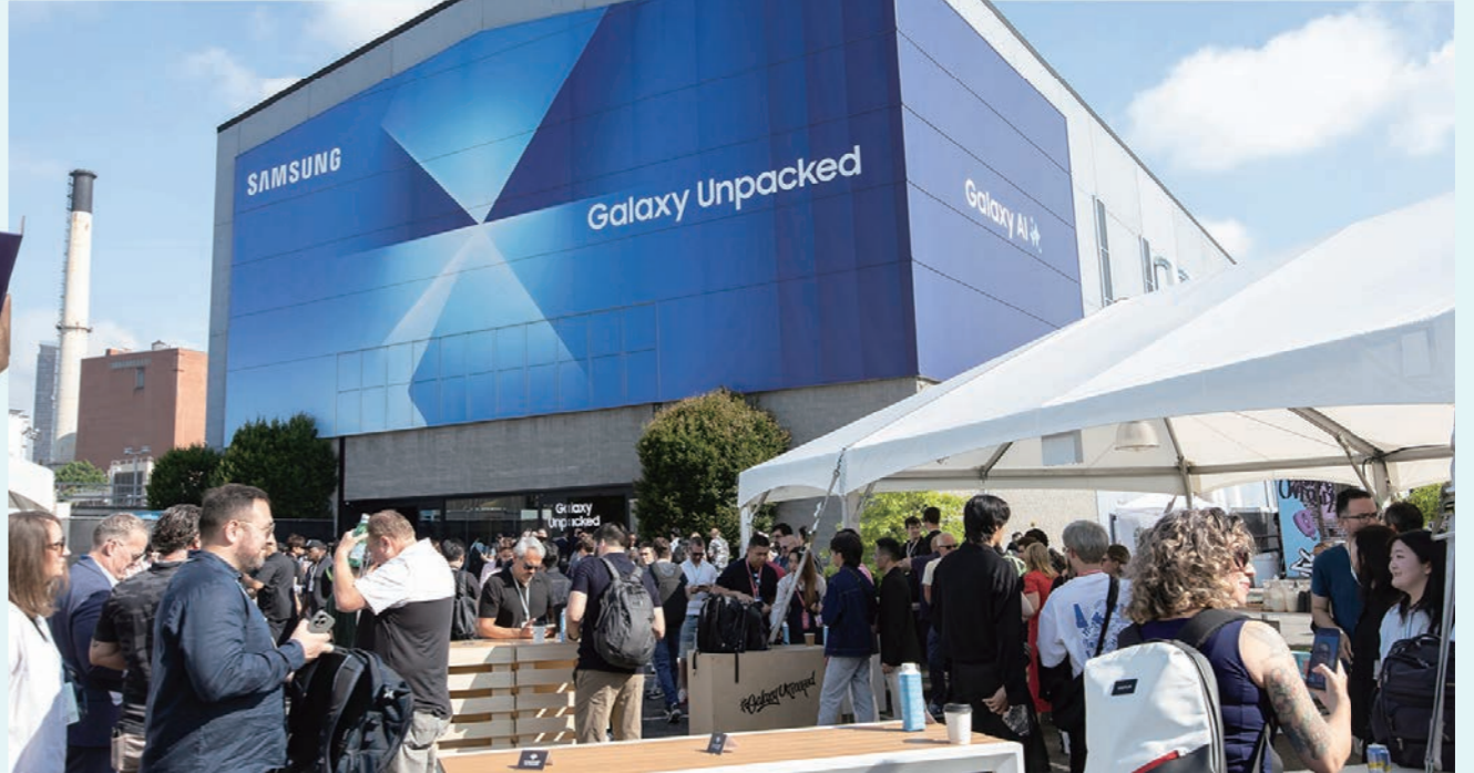
노태문 삼성전자 DX부문장 직무대행 사장이 9일(현지시간) 미국 뉴욕 브루클린 듀갈 그린하우스에서 열린 '갤럭시 언팩 2025(Galaxy Unpacked 2025)' 행사에서 초슬림 대화면 폴더블폰 '갤럭시 Z 폴드7'을 공개하고 있다(왼쪽). 미국 뉴욕 브루클린 듀갈 그린하우스에서 하반기 '갤럭시 언팩 2025' 입장을 기다리고 있는 관람객들.

칩셋 탑재로 전작 대비 NPU 성능은 41% 향상되고 CPU와 GPU는 각각 38%, 26% 향상됐다.