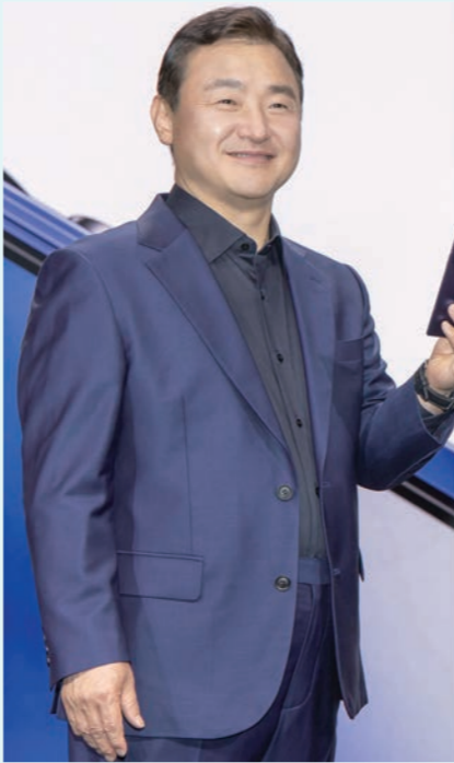
노태문 삼성전자 DX부문장 직무대행 사장이 9일(현지시간) 미국 뉴욕 브루클린 듀갈 그린하우스에서 열린 '갤럭시 언팩 2025(Galaxy Unpacked 2025)' 행사에서 초슬림 대화면 폴더블폰 '갤럭시 Z 폴드7'을 공개하고 있다(왼쪽). 미국 뉴욕 브루클린 듀갈 그린하우스에서 하반기 '갤럭시 언팩 2025' 입장을 기다리고 있는 관람객들.

화면 크기는 외부 6.5인치에 내부 8인치로 전작 대비 커졌다. 여기에 갤럭시용 스냅드래곤 8 엘리트