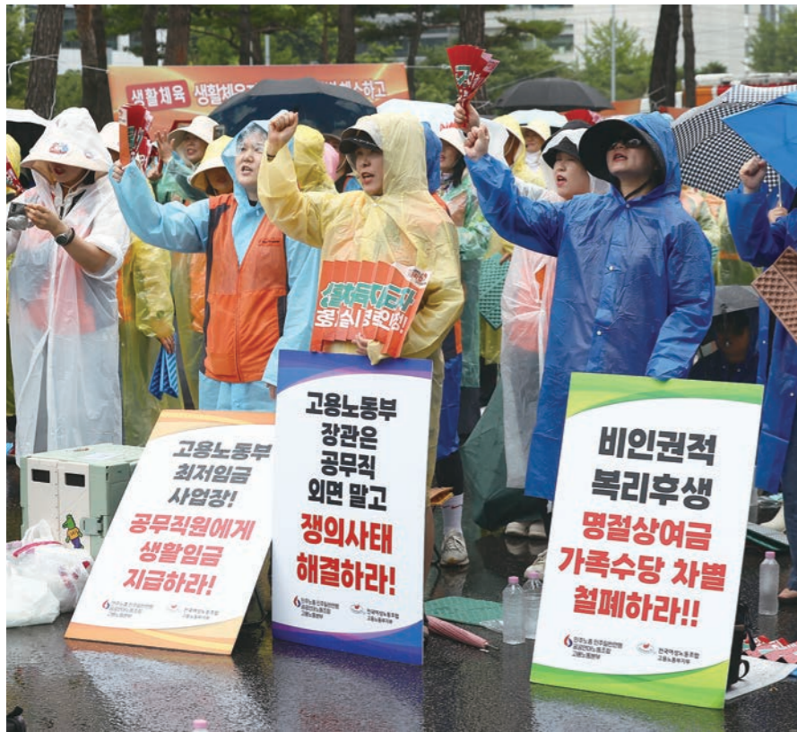
민노총 민주일반연맹 공공연대노동조합이 16일 서울 영등포구 국회 인근에서 연 '연'에서 참가자들이 손팻말을 들고 있다.

서울 등 전국 13곳서 총파업 대화... 정부·국회 본격 압박 "노동자 힘으로 탄생한 정부, 진정성 있는 대화 나서라" 노란봉투법 개정·尹정부 반노동정책 즉각 폐기 요구