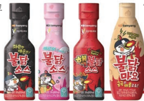
삼양식품에서 출시한 불닭소스, 삼양식품

올렸다. 비비고 고추장과 불고기양념 등 K소스류가 북미와 유럽을 중심으로 호조를 보이며 전체 매출 증가를 이끌었다. 60여 개국에 K소스를 수출하고 있는 CJ제일제당은 현지 소비자 취향에 맞춰 매운맛의 강도를 조절하고, 익숙한 튜브형 포장 상품을 선보이는 등 해외 공략에 속도를 내고 있다. 최근에는 저당·저나트륨 소스 라인을 강화해 건강을 중시하는 글로벌 소비 트렌드에도 발맞추고 있다. 맛과 동시에 건강을 겨냥한 제품도 늘고 있다. 동원푸드사는 '비비드키친' 브랜드를 통해 당류를 최대 86% 줄인 저당 양