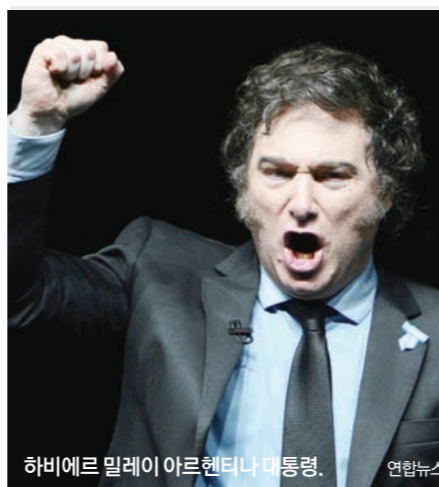
하비에르 밀레이 아르헨티나 대통령.

상승률을 18%~23%로 예상했다. 한때 3000%를 넘었고 현 정부 출범 당시만 해도 211%였다. IMF의 긍정적 전망들이 일명 ‘아르헨티나 (도널드) 트럼프’인 하비에르 밀레이의 2023년 12월 대통령 취임 이래 안정적 거시정책과 성장 회복에 대한 신뢰를 표명한 것으로 해석된다. 아르헨티나는 IMF 최대 채무국이다. 1956년 가입해 지금까지 총 23차례 IMF 프로그램을 이용했으며 현재 400억 달러(55조 원) 이상의 빚을 진 상태지만 밀레이정부 출범 1년 시점부터 IMF로부터 호평을 받기 시작