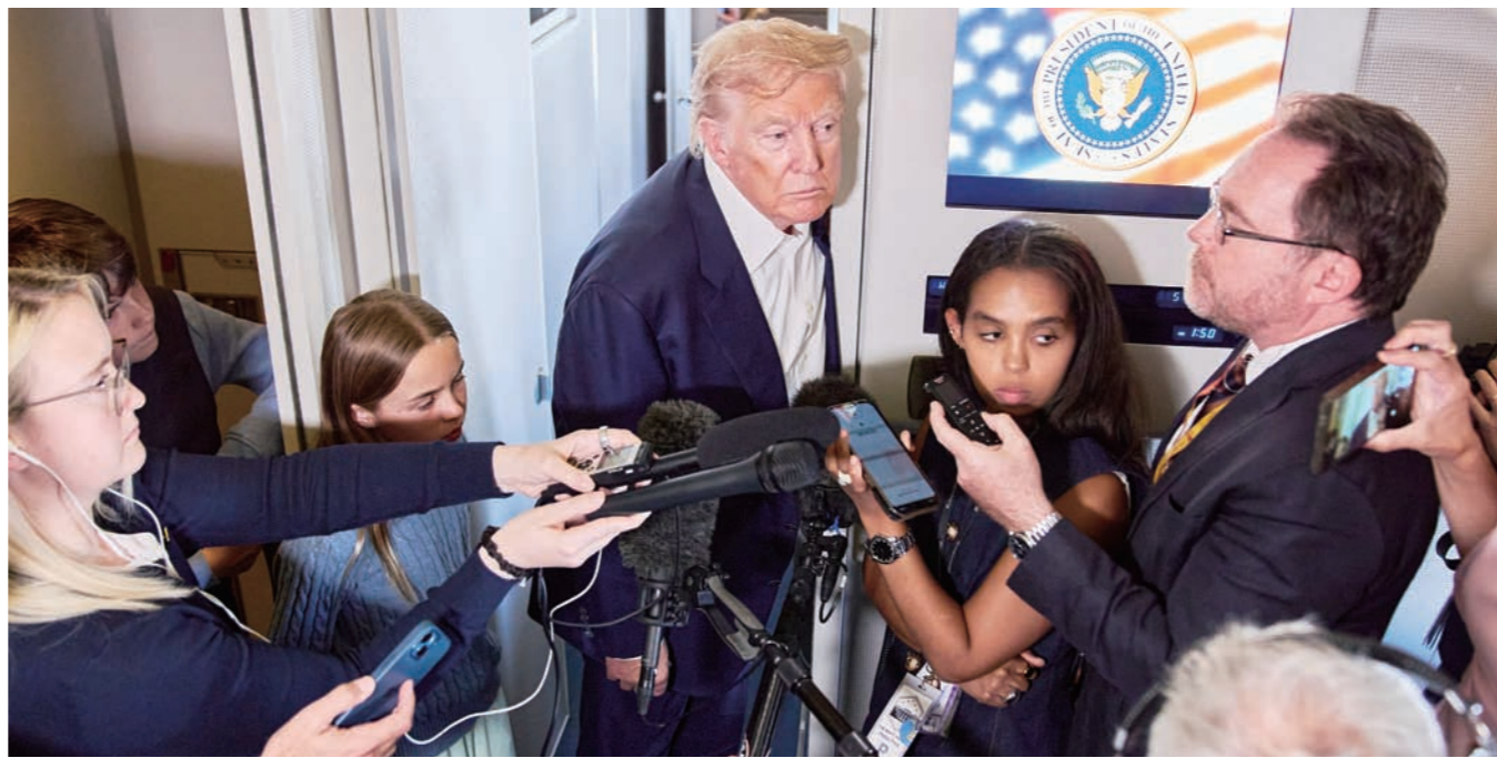
도널드 트럼프 대통령이 29일(현지 시간) 스코틀랜드 애버딘을 출발해 워싱턴DC로 향하는 전용기(에어포스원) 안에서 기자들과 만나고 있다. 3차 미·중 협상에 대한 만족감과 시진핑 중국 국가주석과의 연대 회동을 시사했다.

가장 중요하다. ‘미국 측에서 먼저 연락해 왔다’는 구도를 중시하다 보니, 고위급 회담을 위한 실무진들 ‘밀밀 만남’이 분주한 시점에서 ‘접촉 없다’는 주장을 견지하기도 한다. 5월 1차 협상 직전 관세 ‘폭탄’과 ‘맞대응’을 주고받다가 145%까지 갔을 때, “조만간 협상”을 예고한 트럼프와 중국 외교부 대변인 말이 엇갈렸던 이유다. 워싱턴DC행 에어포스원 위에서 트럼프가 무역 합의의 순조로움을 전하며 “무역 합의는 매우 잘 되고 있다. 모두에게 그렇기 바라지만 우리 입장에서 매우 매우 좋다”고 한 것은 별다른 양보 없이 중국의 사실상 유일한 카드인 ‘히토류 수출 제한 완화 가능성’을 이끌어 냈기 때문으로 보인다. 이번 제3차 스웨덴 스톡홀름 회담 종료 직후 중국 측 대표인 리청강 상무부 부부장은 “관세 유예 90일 연장 지지”와 “양국 간 협력 지속 희망”을 밝혔다. 이 두 가지 사항 관련해 “결정된 게 없다”고 답한 미국에 비해 중국이 더 절박한 상황임을 드러낸 대목이다. 이날 파이낸셜타임스(FT)는 중국이 이번 협상에서 ‘임시 중지’ 전략을 공식 제안