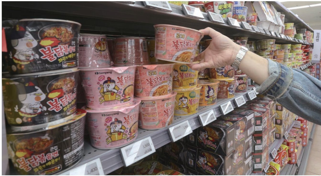
삼양식품은 12일 이사회를 열고 보통주 1주당 2200원의 현금 중간 배당을 의결했다고 공시했다. 서울의 한 마트에서 시민이 불닭볶음면을 구입하고 있다.

증권가에서는 하반기 실적 모멘텀 강화에 주목하고 있다. 6월 완공된 밀양 제2공