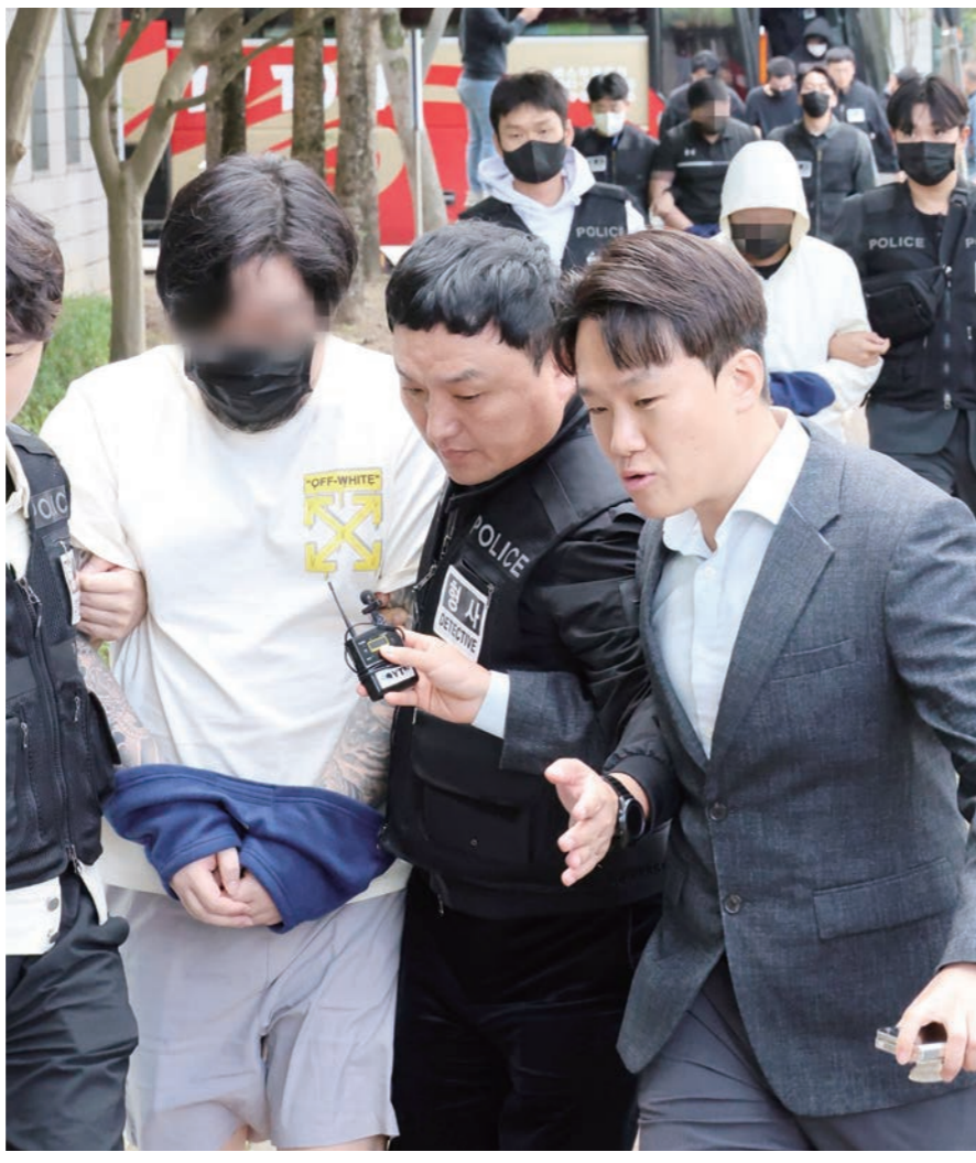
20일 오후 충남경찰청에서 사기 혐의로 수사받는 캄보디아 송환 피의자들이 충남 홍성 대전지법 홍성지원에서 구속 전 피의자심문(영장실질심사)을 받기 위해 법원에 들어오고 있다. 연합뉴스

현시간 뒤 미복귀년 최고 3000명 泰·베트남으로 입국도 상당수 일부 범죄단지엔 사체 조각장 장기매매·사망 숫자 예측 불허