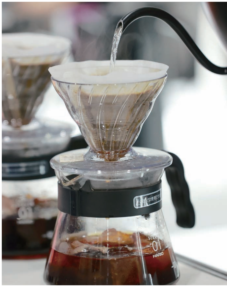
국내 커피 원두 수입액은 13억2783만 달러(1조9000억 원)로 전년(9억681만 달러) 동기 대비 46.4% 증가했다.

작황 부진·관세 폭탄에 국제 시세 쑥... 환율까지 뛰어서 경쟁 치열한데 선불리 값 올렸다면 후폭풍 우려 업계, 일단 재고로 버티기... 이르면 연말 값 인상할 듯