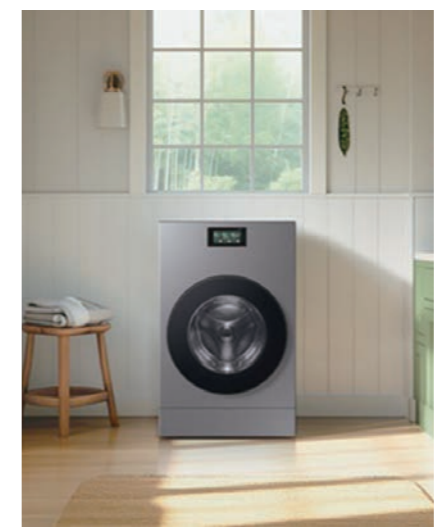
삼성전자가 호주에서 가장 사랑받는 가전 브랜드로 선정됐다. 삼성전자 '비스포크 AI 콤보' 세탁건조기 라이프스타일 이미지. 삼성전자

가장 사랑받는 △가장 신뢰하는 △최고의 가치 △최고의 성능 △가장 추천되는