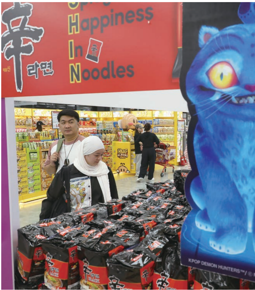
국내 식품·외식·주류·음료기업들이 앞다퉀 경주 행사장에서 K푸드와 체험 공간을 선보인다. 지난달 24일 서울의 한 대형마트에 마련된 외국인 관광객 특화매장에서 한 관광객이 한국 과자를 살펴보고 있다.

국내 주요 유통·식품·뷰티 기업들이 경북 경주에서 열리는 '2025 아시아태평양 경제협력체(APEC) 정상회의'를 계기로 세계 각국 정상과 기업인 앞에 한국 제품의 경쟁력을 선보인다. APEC 기간 동안 경주 전역은 사실상 'K브랜드 쇼케이스'로 변모한다.