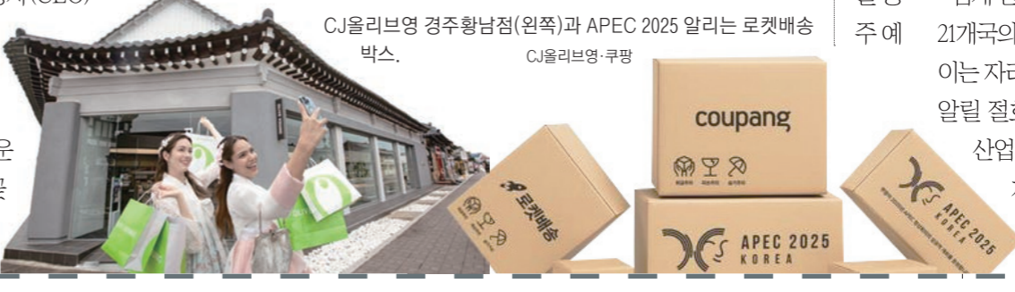
CJ올리브영 경주황남점(왼쪽)과 APEC 2025 알리는 로켓배송 박스.

투숙객에게 K뷰티 클렌저·마스크 샘플 키트를 증정한다. 구미대는 스킨케어부터 메이크업까지 K에스테틱 실습 체험존을 운영한다. 국내 패션 브랜드 마케팅은 공식 협찬사로 선정돼 카드지갑·캐논·백을 제공한다. 29일 월정교에서는 한복 패션 쇼가 열린다. 이번 행사에는 국내 유통 대기업 최고 경영진이 대거 참석한다. 신동빈 롯데그룹 회장, 정용진 신세계그룹 회장, 정지영 현대백화점 대표, 허서홍 GS리테일 대표, 박대준 쿠팡 대표 등이 경주를 찾는다. 28