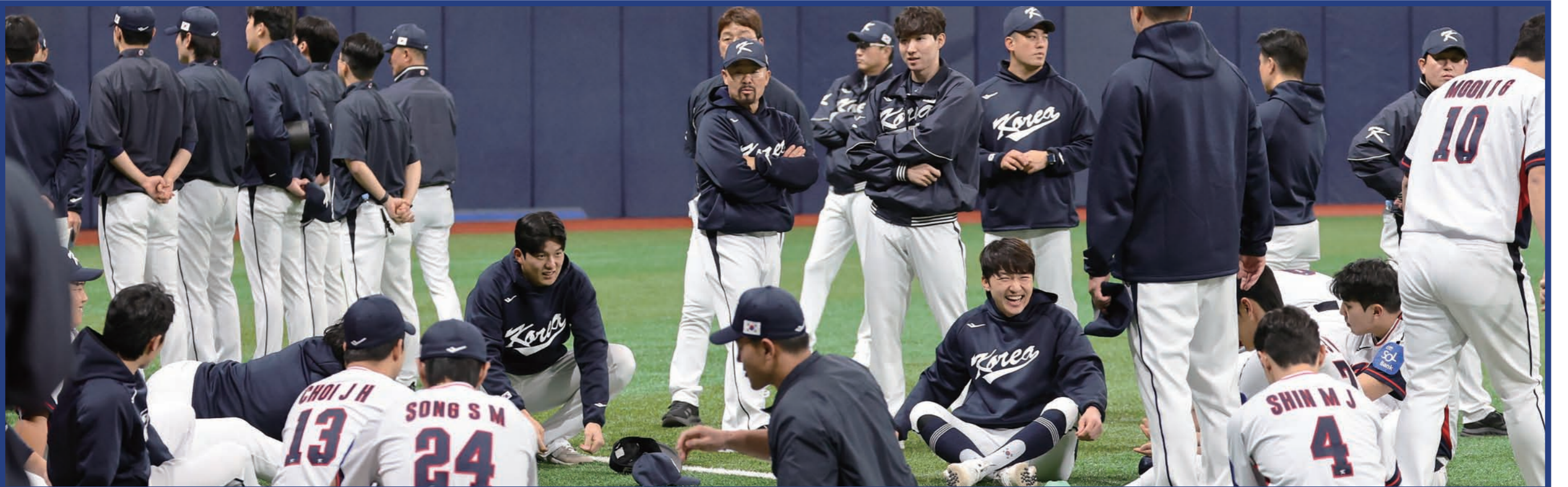
11일 서울 고척스카이돔에서 야구대표팀 선수들이 일본과의 두 차례 원정 평가전을 앞두고 박바지 훈련에 구슬땀을 흘리고 있다. 야구대표팀은 15일과 16일 일본 도쿄돔에서 일본 대표팀과 평가전을 치른다.