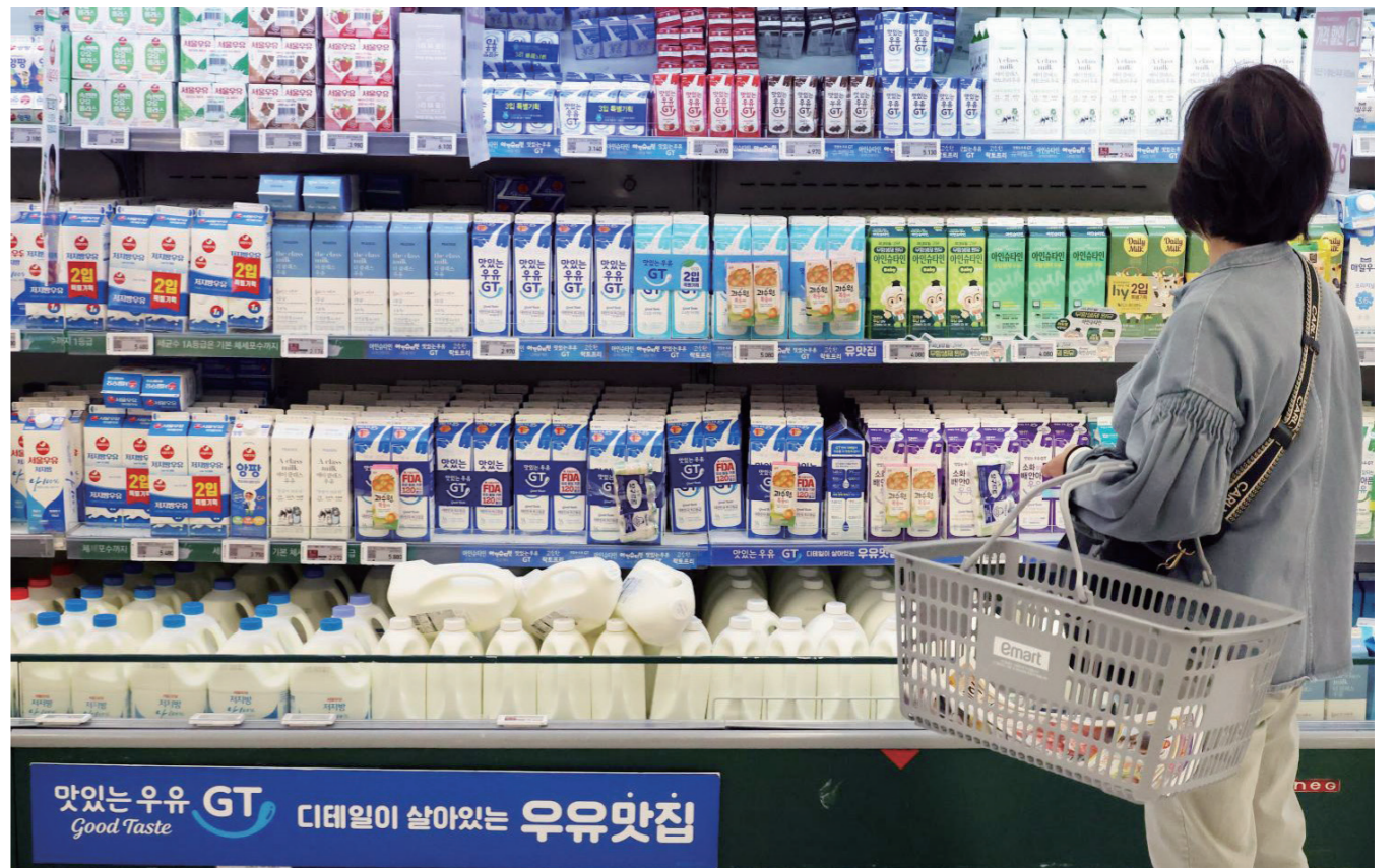
서울 시내 대형마트에 우유가 진열돼 있다.

간 형평성 문제도 꾸준히 제기돼 왔다. 유업계는 "수입 멸균우유와 국산 신선우유는 신선도·영양 구성에서 차이가 있어 소비자가 구분할 수 있도록 해야 한다"고 강조한다. 그러나 외식업계를 중심으로서는 신중론이 만만치 않다. 메뉴 구성이 복잡한 데다 원가 변동에 따라 우유 공급처를 자주 바꿀 수밖에 없는 구조에서 매년 원산지를 수정·관리하는 것은 중소기업에 큰 부담이라는 주장이다. 실제로 한국소비자원 조사에서도 프랜차이즈 음식점 80곳 중 절반 이상이 원산지 표시를 제대로 지키지 못한 것으로 드러나 규제 강화가 현장 혼란으로 이어질 수 있다는 우려도 나온다. 전문가들은 제도 도입의 필요성을 인정하면서도 "업종별로 세분화된 기준과 충분한 준비기간이 병행돼야 한다"고 강조한다. 단순히 의무 품목을 확대하는 방식만으로는 시장 혼란을 피하기 어렵기 때문에 카페·베이커리 등 소규모 매장은 단계적 도입이 필요하다는 것이다. 또한 메뉴 간 교체 비용, 단속·과태료 부담 등을 줄이기 위한 보완책 마련도 필수라는 의견이 잇따른다. 식품업계 관계자는 "원산지 표시는 소비자의 알 권리를 보장하고 시장 투명성