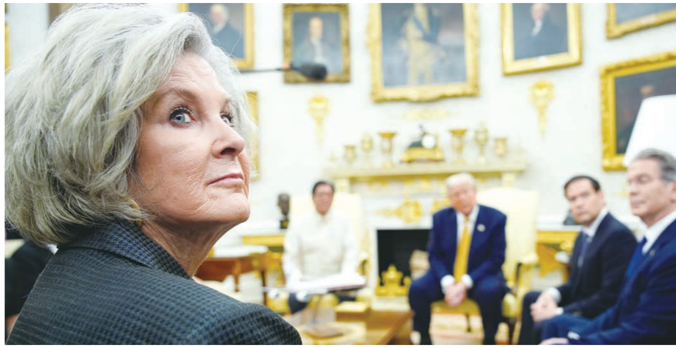
도널드 트럼프 미국 대통령의 최측근으로 평가받는 수지 와일스(왼쪽) 백악관 비서실장의 인터뷰 기사가 16일(현지 시간) 공개됐다.

와일스 실장은 민주당 출신인 빌 클린턴 전 대통령이 성착취범 고(故) 제프리 엡스타인이 성범죄를 저지른 후 화해제약이 있는