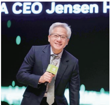
엔비디아가 인공지능(AI) 가속 칩 스타트업 그록을 약 200억 달러에 인수하기로 합의했다. 젠슨 황 엔비디아 최고경영자.