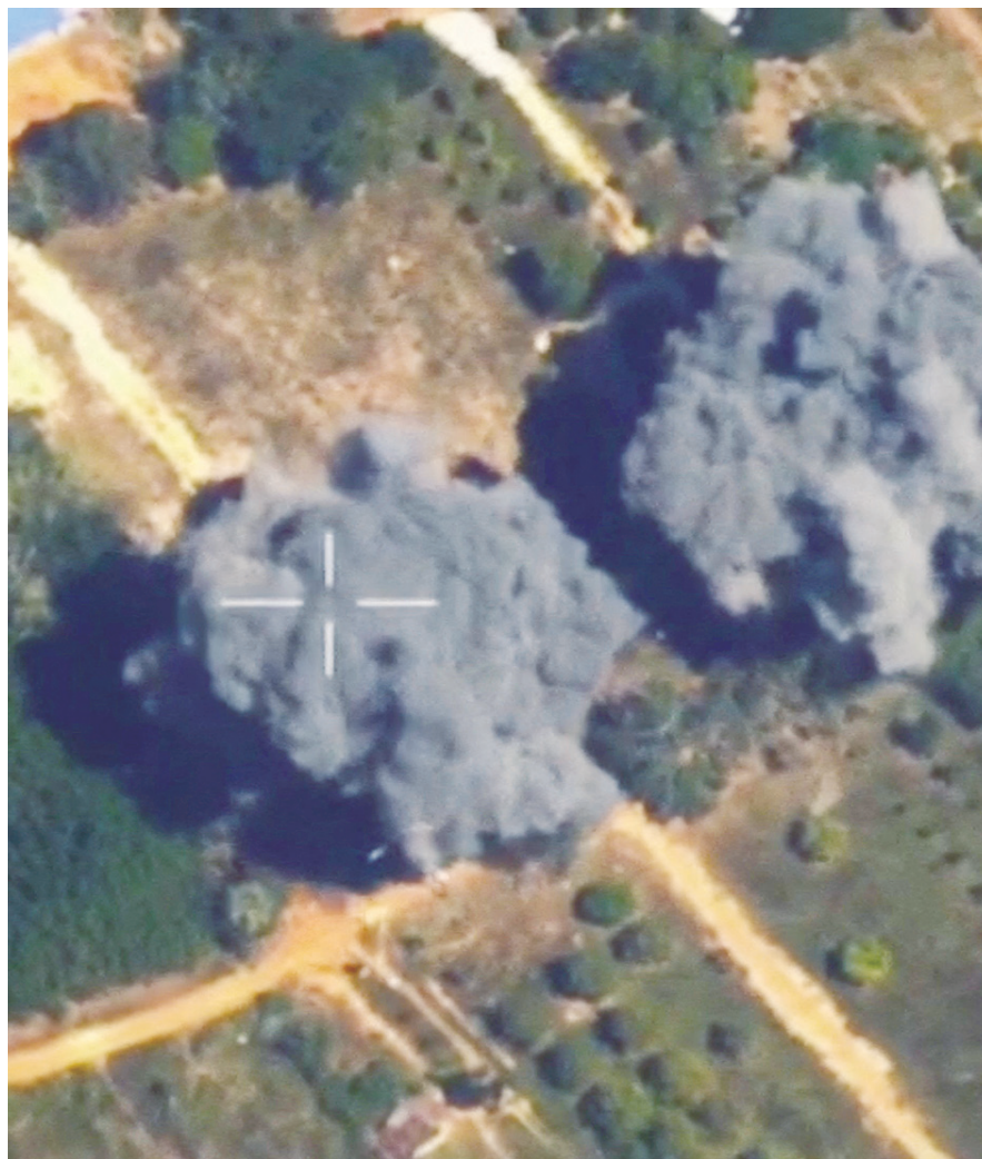
태국과 캄보디아가 최근 무력 충돌로 86명의 사망자가 발생한 가운데 첫 휴전 회담을 열었으나 35분 만에 끝났다. 이날 중순 태국군이 캄보디아 공습할 당시 모습.

이후 지난 10월 트럼프 대통령 중재로 휴전 협정을 체결했으나 지난달 10일 태국