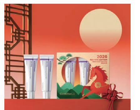
센텔리안24 '마데카 크림 타이트 리프팅 레드 라이즈 에디션' 동국제약

동국제약이 더마코스메틱 브랜드 센텔리안24의 신제품 '마데카 크림 타이트 리프팅 레드 라이즈 에디션'을 출시했다. 5일 동국제약에 따르면 이번 신제품은 병오년 붉은 말의 해를 맞아 활동적으로 역동적인 기운을 담아 기획한 한정판이다. 크림 구성은 '마데카 크림 타이트 리프팅'(50ml) 2개 입으로 되어 있다. 마데카 크림 타이트 리프팅은 피부 노화의 속도를 늦춰 보다 건강한 상태로 전환하는 지속노화를 콘셉트로 다각도 리프팅 안티에이징 솔루션을 제공한다. 피부 간에 수분을 촘촘하게 채우고 피부 부선을 탄탄하게 정돈하며 얼굴 전체를 끌어올리는 피부 저속노화 3단 메커니즘을 제공한다. 이를 통해 피부 탄력을 복합적으로 케어하고 맨 피부에도 생기