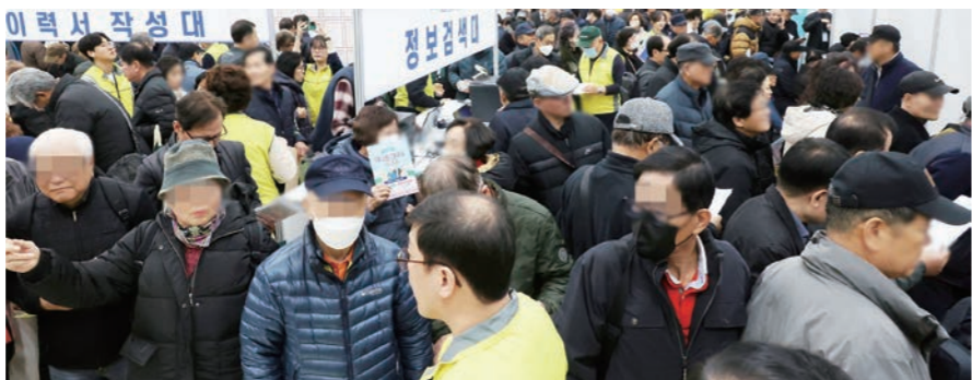
이력서 작성대 지난해 11월17일 서울 은평구청에서 열린 '은평 어르신 일자리박람회' 현장이 일자리를 상담하기 위해 온 어르신 구직자들로 붐비고 있다.

한은, 실제 고용 상황 결과 발표 건설 부진에 2024년 이후 위축 소비 늘어나 고용 증가세 반전