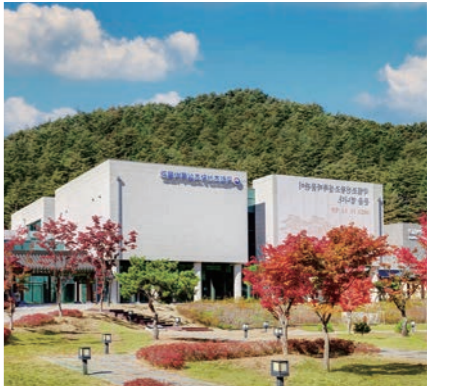
국립조선왕조실록박물관 전경. 국립조선왕조실록박물관

“99명의 수행자를 만났다”고 표현했던 선재스님은 가장 인상 깊었던 ‘수행자’로 후덕축 셰프를 꼽았다. “팁전에서 아이디어를 많이 내고 잘해 준 임성근 셰프도 훌륭하지만, 저보다도 나이가 많으신 후덕축 셰프님이 조력을 해주셔서 화합을 끌어내 이길 수 있었습니다” 카메라 밖에는 수백 명의 다른 수행자들도 있었다. 그들과 함께 한 경험도 스님에게 또 다른 수행이었다. “사람들이 자기 삶에서 얼마나 열심히, 치열하게 살고 있는지 현장에서 봤습니다. 그 많은 스테프가 움직이는데 거슬리는 소리를 한 번도 들은 적이 없어요. 각각의 자리에서 최선을 다하는 데서 성공이 온다는 걸 다시 깨달았죠.” 재료를 대할 때 자연에 감사하는 마음을 갖고, 재료 하나하나의 성질과 먹는 사람의 체질을 고려해 재료와 사람 사이 ‘동역사’처럼 요리한다는 선재스님은 바쁜 현대인이 일상에서 실천할 수 있는 건강한 선택으로 제철음식을 권했다. “유기농은 비싸죠. 제철음식은 싸면서 유기농에 가까운 에너지를 갖고 있어요. 약념(藥念)을 잘 이해하고 요리하면 제철음식이 약이 됩니다. 자연을 거스르지 않는 음식이 제일 좋은 음식이죠.” 연합뉴스