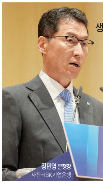
IBK형 생산적 금융 프로젝트 장민영 은행장

업·소상공인 부문에 배정한다. 또한 AI, 반도체, 에너지, 첨단 제조, 디지털 전환 등 전략 산업에 대한 금융 공급을 확대하고, 운전자금 중심에서 투자·설비기술 사업화 자금 중심으로 무게를 옮긴다. 기술력과 성장성을 여신 심사에 적극 반영해 담보 중심 관행에서 벗어나겠다는 방향이다. 지역 산업 지원이라는 과제도 놓치지 않는다. 기업은행은 지역 산업 생태계 지원을 강화하고, 정부 부처 및 지방자치단체와 협업해 지역특화산업과 국가전략산업 중심의 금융 지원 체계를 구축할 계획이다. 설비투자 특별지원 프로그램과 지방시대 벤처펀드 출자, IBK창공 프로그램에 더해 2026년부터 지방 우대 프로젝트도 가동한다. 장 행장은 기업 생애주기별 맞춤형 금융을 강화하고, 기술력과 성장성을 반영하는 여신 심사 체계로 혁신하겠다고 설명했다.