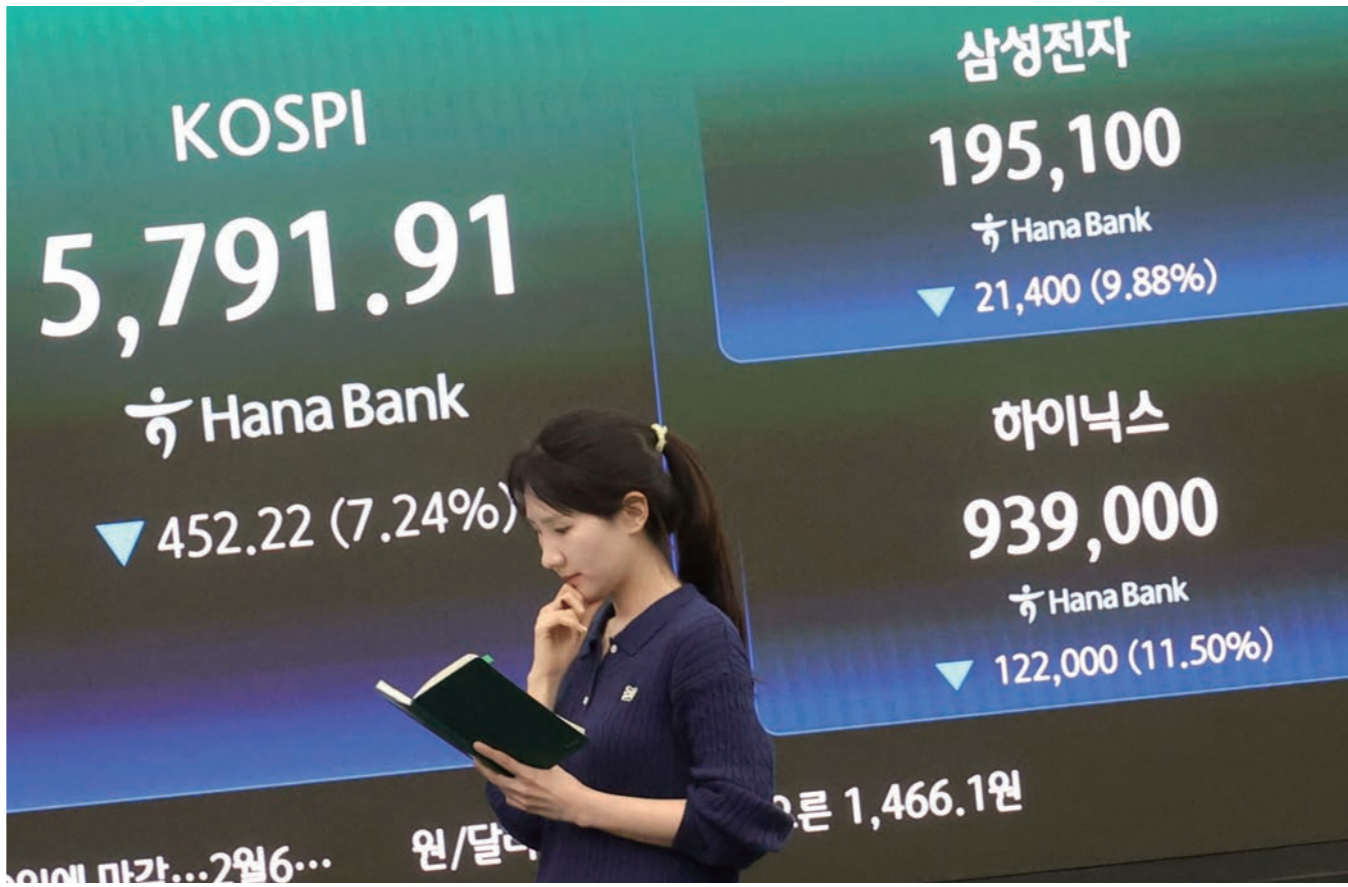
미국과 이란 전쟁 여파로 국내 증시가 급락한 3일 서울 중구 하나은행 본점 딜링룸 전광판에 증가가 표시되고 있다. 이날 코스피 지수는 전 거래일 대비 452.22포인트(7.24%) 내린 5791.91에, 코스닥은 55.08포인트(4.62%) 내린 1137.70에 장을 마감했다. 박미나 기자