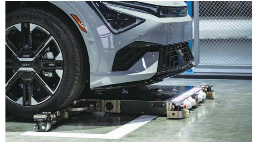
현대차그룹, 주차로봇 활용한 EV6 주차시설.