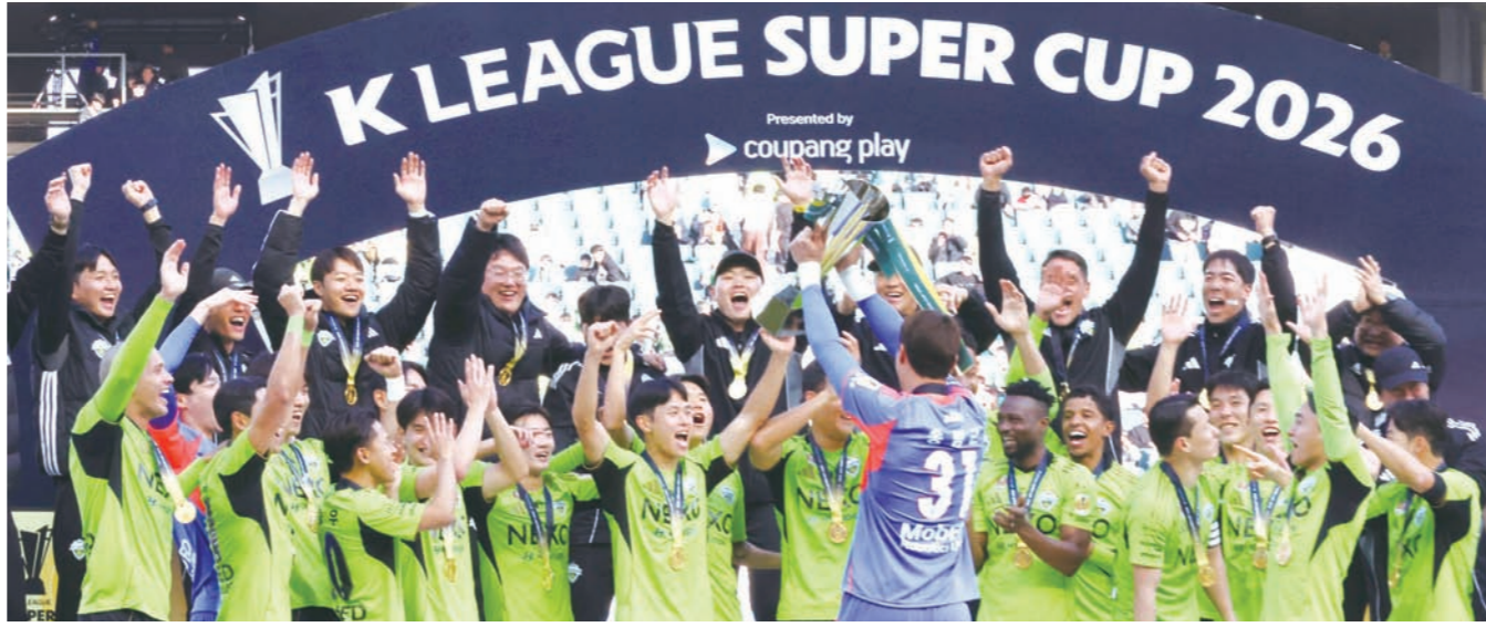
지난달 21일 전북 전주월드컵경기장에서 열린 '쿠팡플레이 K리그 슈퍼컵 2026' 전북 현대와 대전 하나 시티즌 경기에서 우승한 전북 현대 선수들이 기뻐하고 있다.

세가 올라왔다. (슈퍼컵에서) 한 번 대결해 봤으니 잘 준비해 보겠다"면서 "분위기가 좋았을 때 쪽 밀고 나가겠다"고 연승 의지를 드러냈다.