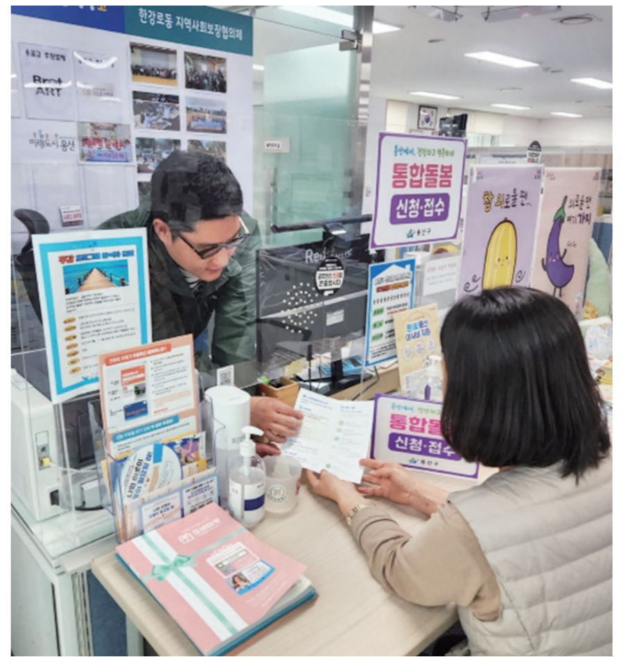
용산구 한 동주민센터에서 주민이 '용산형 통합돌봄' 사업에 대해 안내를 받고 있다.