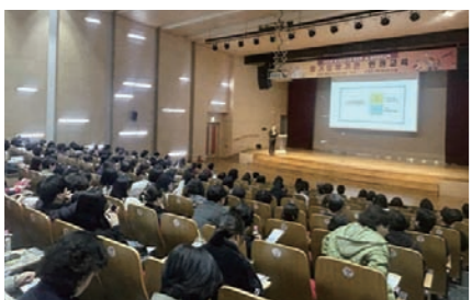
안산시 1일 장기요양기관 종사자를 대상으로 인 권교육을 실시했다. 안산시