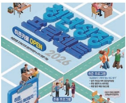
군포시와 청년공간 플라잉이 '2026년 청년성장프로젝트' 참여자를 모집한다. 군포시