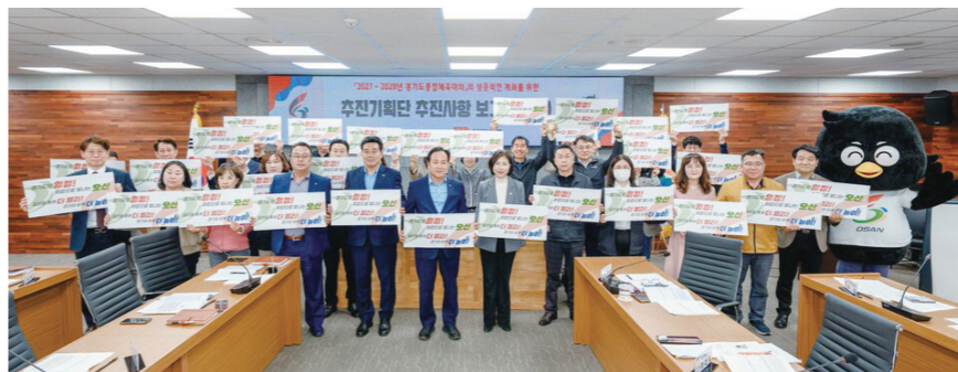
오산시가 2027~2028년 경기도종합체육대회 본격적인 준비에 나섰다.

비와 함께 도시 전반의 수용 태세를 정비해 방문객들에게 쾌적하고 안정적인 환경을 제공한다는 계획이다. 이를 통해 단순한 체육행사를 넘어 경기도민이 함께 즐길 수 있는 모범적인 스포츠 축제로 자리매김하겠다는 목표다.