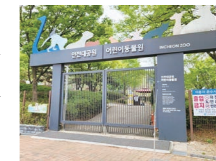
인천광역시 인천대공원사업소가 구제역 예방을 위해 휴원 중이던 어린이동물원을 14일 재개방한다.

우, 미어켓, 일본원숭이, 다람쥐원숭이, 꽃사슴, 독수리, 수리부엉이 등 총 31종 125두의 동물을 사육하고 있다. 동물원 운영시간은 오전 10시부터 오후 5시까지이며 휴원은 매주 월요일과 설날, 추석 당일이다.