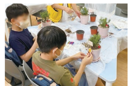
남양주시농업기술센터가 학교로 찾아가는 농업체험을 확대 운영한다. 초등학생들이 화분 만들기를 하고 있다.