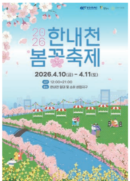
광명문화재단이 한내천과 소하 상습지구 일대에서 '2026 한내천 봄꽃축제'를 개최한다.

송은영 대표이사는 "바쁜 일상에서 잠시 숨을 고르고, 가족·이웃·친구와 함께 한내천의 흐드러진 봄꽃 사이를 거닐며