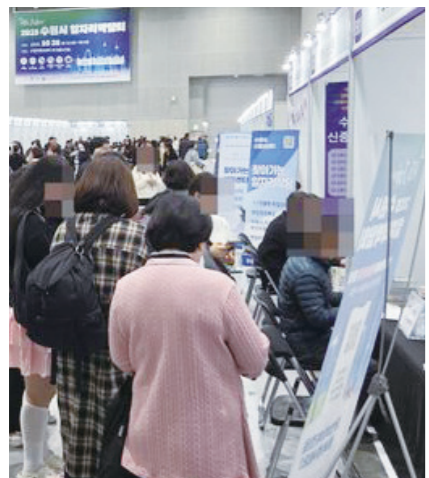
지난해 'AI로 JOB자:2025 수원시 일자리박람회'가 수원컨벤션센터 전시홀에서 열렸다.