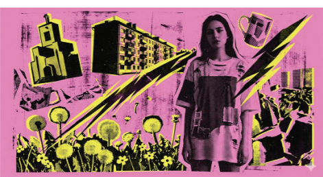
AI 생성 이미지

그레도 모스크바 민들레의 노란색이 싫지 않은 건, 단지 그것이 6개월간 이어지는 길고 추운 모스크바 겨울의 끝을 전하러 달려온 봄의 전령이라는 기특함 때문만은 아니었다. 인공 물감과 다르게, 천연 노란 빛은 찬란한 아름다움이 있었다.