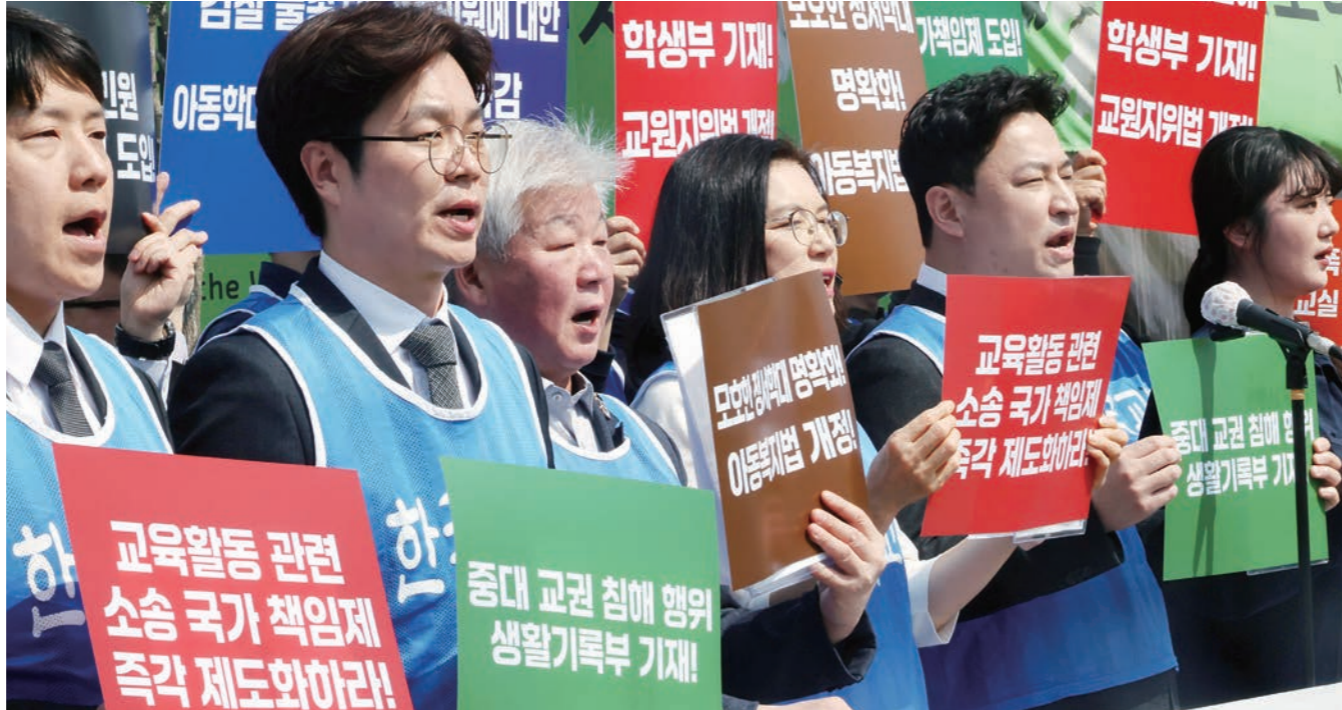
“교권 보호 입법하라” 한국교원단체총연합회(교총) 관계자들이 15일 서울 여의도 국회 앞에서 ‘교권 보호 제도 개선 촉구 기자회견’을 열고 구호를 외치고 있다. 이날 교총은 폭행·상해 등 중대 교권 침해 사안의 학교생활기록부 기재를 골자한 교원지위법 개정 등 5대 핵심 요구사항을 발표하며 국회와 정부의 조속한 입법 대응을 촉구했다. 이종원 기자

중동전쟁과 원달러 환율 상승 여파로 3월 수입물가가 IMF 외환위기 이후 최대폭으로 급등했다. 한국은행은 15일 발표한 3월 수출입물가지수 및 무역지수(잠정)에 따르면 수입물가지수는 169.38로 전월(145.88)대비 16.1% 상승했다. 전년동월대비도 18.4% 올랐다. 기준연도 2020년을 100으로 놓은 원화 기준 지수다. 전월대비 16.1% 상승은 외환위기 국면이던 1998년 1월(17.8%) 이후 28년 2개월 만에 최고치다. 전년동월대비 18.4% 상승 역시 2022년 10월(19.8%) 이후 약 3년 5개월 만이다.