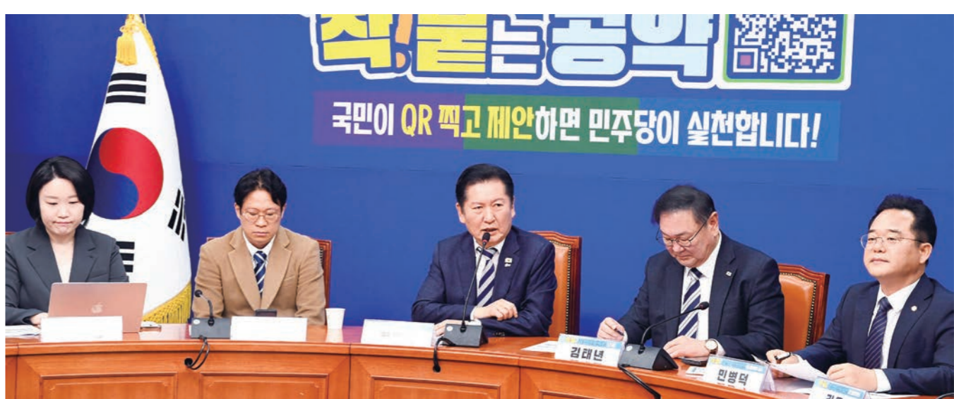
정청래(가운데) 더불어민주당 대표가 16일 국회에서 열린 ‘착!불 공약 프로젝트’ 8·9호 공약 발표 행사에 참석해 인사말하고 있다.

현재 영구임대주택과 국민임대주택은 자산 등 요건을 충족하지 못하더라도 1회