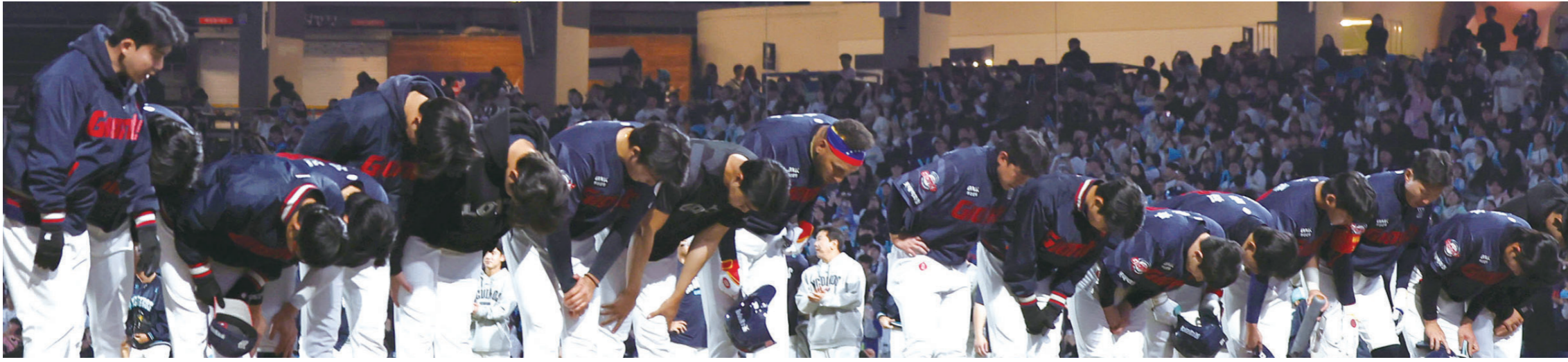
지난달 31일 경남 창원NC파크에서 열린 NC 다이노스와의 원정전을 2대9로 패한 롯데자이언츠 선수단이 팬들에 고개숙여 인사하고 있다.