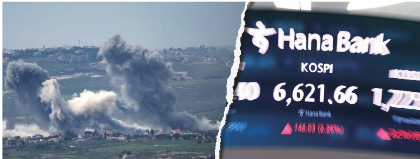
26일(현지 시간) 이스라엘군이 레바논 남부를 공습했다. 주식 시장의 경우 지정학적 리스크가 커졌음에도 코스피는 27일 장중 6621.66까지 올랐다.

미국이란 전쟁 발발 이후 레바논 시아파 무장 단체 헤즈볼라가 이스라엘을 공격하며 전쟁이 확대됐다. 헤즈볼라는 대표적 인 친이란 세력으로 분류된다. 미국과 이란이 휴전에 합의했을 당시 이스라엘은 미국-이란 전쟁 휴전과 헤즈볼라는 관련이 없다고 주장했고, 이란이 이에 반발하며 레바논 전쟁으로 휴전이 깨질 수 있다는 우려가 있었다. 이후 이스라엘과 헤즈볼라는 휴전을 발표했으나 양측 간 충돌