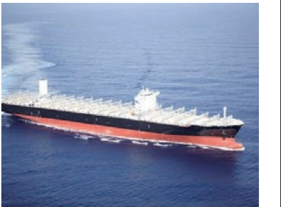
HJ중공업이 건조한 컨테이너선. HJ중공업