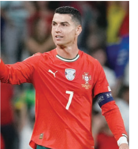
크리스티아누 호날두가 포르투갈 대표팀 소속으로 6번째 월드컵에 나선다.

마르티네스 감독은 "이번에 선택받은 선수들은 엄중하고 정직한 과정을 거쳐 선발됐다. 월드컵 예선뿐만 아니라 네이션스리그 우승을 함께 했던 모든 선수가 대표팀의 일원이 됐다"라고 설명했다.