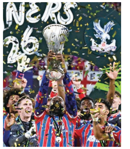
크리스털 팰리스가 창단 121년 만에 처음으로 유럽 대항전 정상에 올랐다.