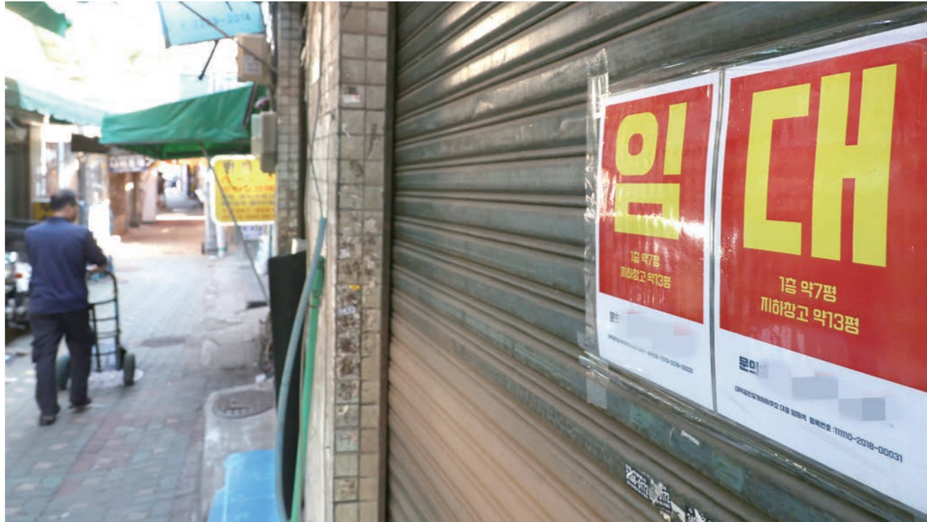
얼어붙은 골목상권 대기업 중심의 수출 증가가 민간 소비와 내수 활성화로 이어지지 못해 양극화가 심화되는 가운데 25일 서울 시내 한 업소에 임대 현수막이 붙어 있다. 반도체와 자동차를 필두로 한 수출이 역대급 호조를 보이며 거시경제 지표는 온기를 띠고 있으나, 고물가와 고금리 장기화로 인한 소비 위축으로 골목상권은 얼어붙고 있는 모양새다. 박미나 기자

기업 체감경기가 한 달 만에 하락 6월 CBSI 1.2p 떨어져 97.7 기록 반도체·車 등 일부 업종만 호조 여가·운수창고업 등 침체의 늪 7월도 화학물질·장비업 '흐림'