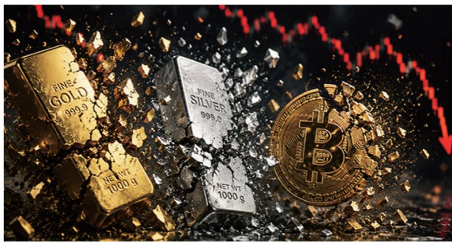
iM증권이 25일 발간한 보고서에 따르면 금·은·비트코인이 이를 연속 동반 약세를 보였다. 시생성 이미지

23일과 24일 각각 5.4%, 6.8% 내렸고, 비트코인은 같은 기간 3.1%, 2.3% 하락했다. iM증권은 자산 가격 동반 급락의 배경으로 △긴축 우려와 달러 강세 △투기적 수요 급감 △대형 AI 기업으로의 유동성 쏠림 △중국 경기 회복 지연 등을 꼽았다. 가장 큰 변수는 긴축 리스크다. 연초만 해도 미국 연방준비제도의 추가 금리 인하 기대가 컸지만, 최근에는 금리 인상 가능성이 나오며 투자 심리가 빠르게 식고 있다. 미 국제 금리 상승과 달러화 강세가 맞물리며 이자를 지급하지 않는 금과 은의 기회비용이 커진 점도 하락 요인이다. 달러 강세도 부담이다. 미국 경제는 견조한 흐름을 이어가는 반면 유로존은 침체