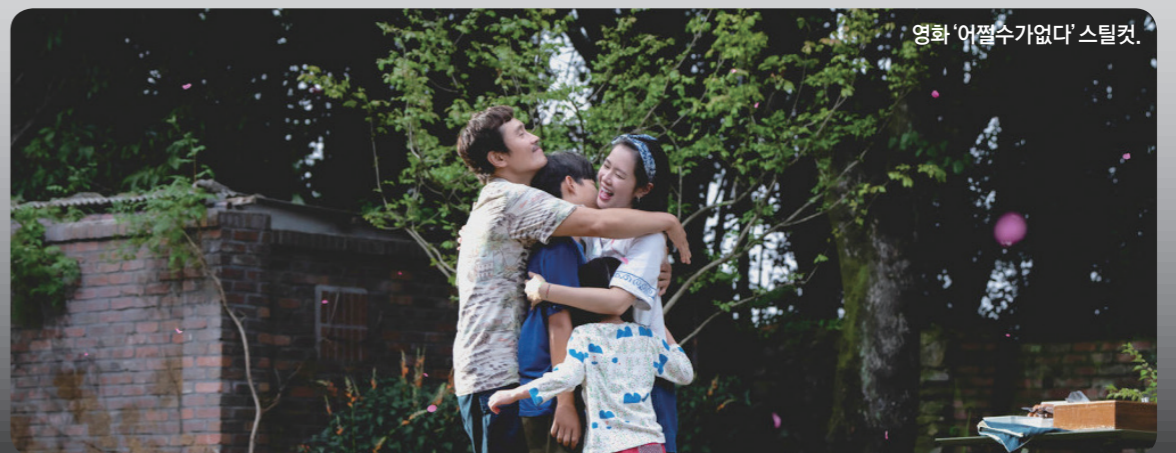
영화 '어쩔 수가 없다' 스틸컷.